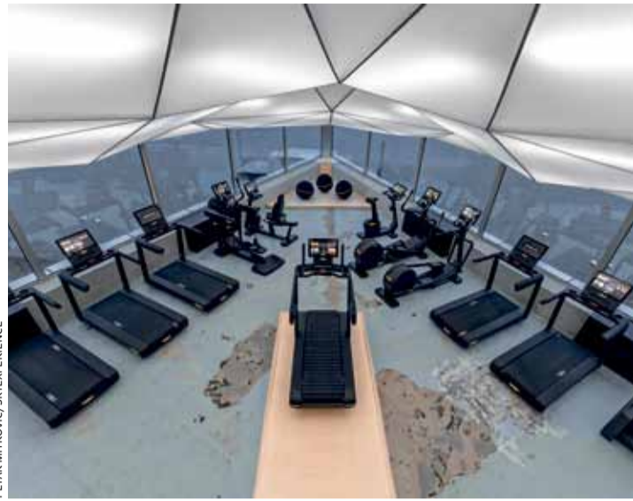
PETAR MITROVIC / SKYEXPERIENCE

● Βιομηχανική αισθητική με θέα στο Wellness Experience του Βελιγραδίου.