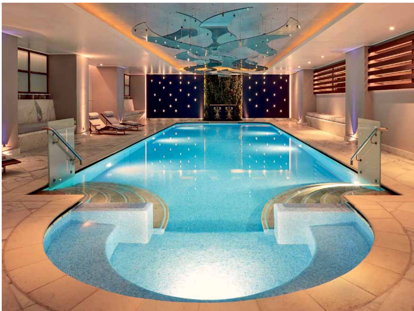
LUXURY COLLECTION HOTELS

● Η εσωτερική πισίνα του GB Spa στο αθηναϊκό Ξενοδοχείο Grande Bretagne (δεξιά) και στιγμιότυπο από χαλαρωτική θεραπεία που παρέχεται στις εγκαταστάσεις του spa (κάτω).