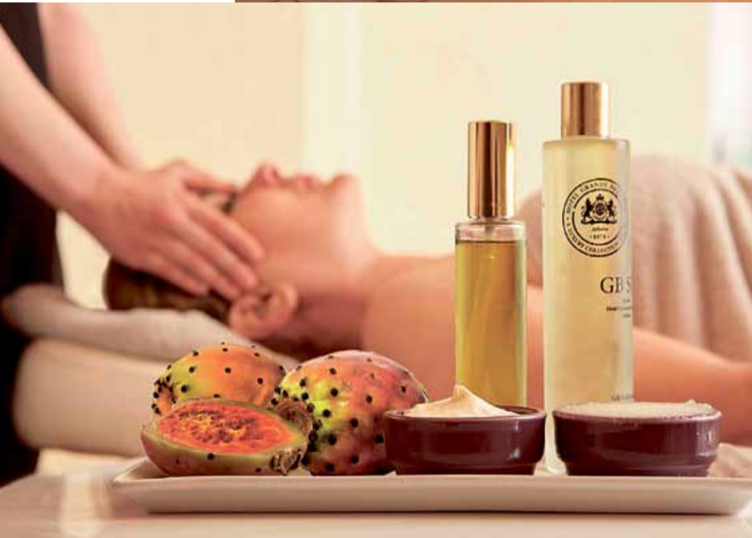
LUXURY COLLECTION HOTELS