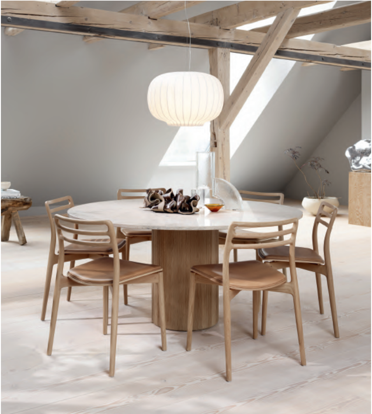
Cabin Round Table and Chairs