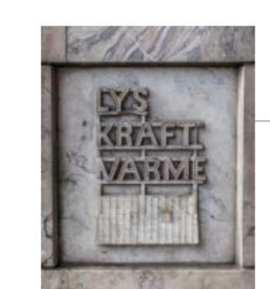
Asbjørg Borgfeldts relief fra 1931 med Oslo Lysverkers motto.