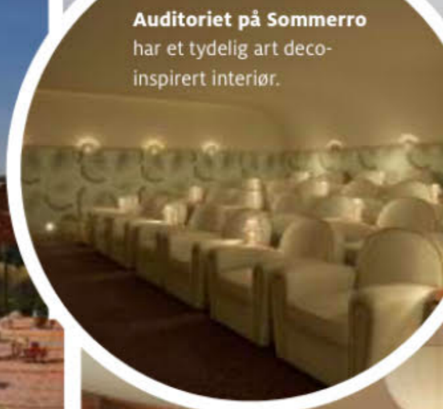
Auditoriet på Sommerro har et tydelig art deco-inspirert interiør.